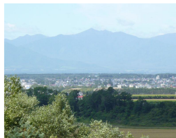
日高山脈が一望できる高台のオアシス

感謝の心、つなぐ手に和み、笑顔あふれる暮らしの応援隊として、「利用者満足、地域満足、職員満足」を目指します。