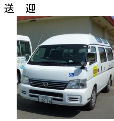
車椅子対応の専用車両で送迎いたします