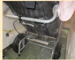
↑専用ボディシャンプーで洗浄中 照本：気持ちいい！

シャワーに近いものがありますが、体の芯まで温めてくれる為、入浴後もポカポカ状態が続きます。実際に入浴体験してみると、体がしっかりと洗浄され、洗剤の匂いが残っていないのがわかりました。入浴後も体が温かく、発汗して整ってしまいました。さらに、お肌がすべすべツルツルになる美容効果が期待できるようです。この商品が納品されたらご利用者の皆様に入浴していただき、効果を実感してくださいね。