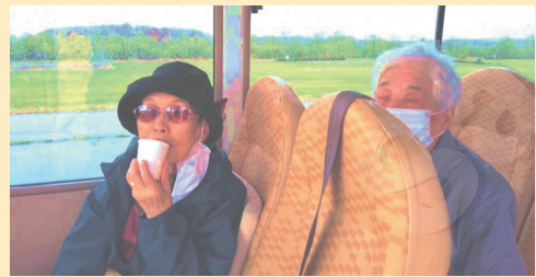
↑温かいお茶を飲みながら桜の見物です

コロナ禍になつて、昨年までは送迎中の短い時間で桜を見ていたのですが、今年はコロナが落ち着いてきた為、デイサービスのバスに乗って帯広の河川敷まで向かいました。