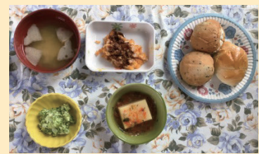
↑豪華なランチです！

4月30日、花グループにて食事会を開催しました。色とりどりの和洋折衷のメニューで食欲に刺激を与えてくれます。普段はパンを食べることが少ない為、利用者様にとっても喜んでいただけました。次の食事会も利用者様が満足できるように企画していきたいです。