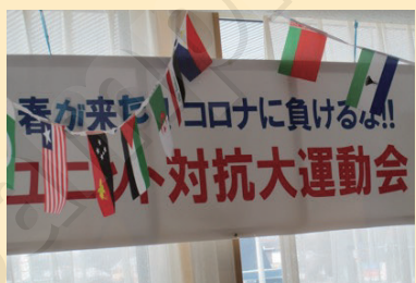
↑大運動会はーじまーよー

3月27日、大運動会を開催しました。種目は《体操》、《ボーリング》、《パン食い競争》、《玉入れ》の計4つの競技をしました。コロナ禍での開催が難しく施設内での開催となりました。