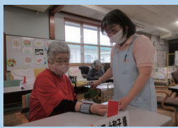
↑一人ずつ丁寧に朝の健康チェックをしています。