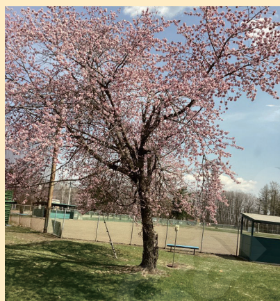
↑札内寮周辺にある桜 とてもきれいですね