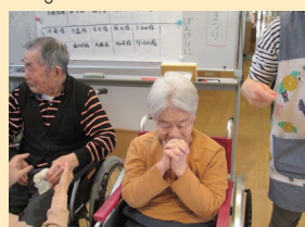
↑一位取れますように〜

3月27日、大運動会を開催しました。種目は《体操》、《ボーリング》、《パン食い競争》、《玉入れ》の計4つの競技をしました。コロナ禍での開催が難しく施設内での開催となりました。