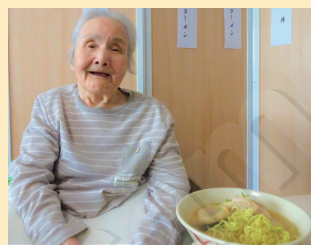
↑久しぶりのラーメンだよ

「今度は醤油ラーメンがいいね」とリクエストもいたったので、今回の企画の参考にさせていただきます。