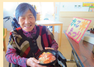
↑私の勝手丼豪勢でしょ(婦)

3丁目では別日で利用者様の歓迎会として勝手丼祭りやラーメンフェスが開かれました。勝手丼ではネタ選びの際に「何個でも選んでもいいの?」、「私エビ好きだから沢山のせてもらおうかな〜!」とワクワクした表情が見られ、「ビールに合う」、「どのネタも当たり」と皆様ご満悦。ラーメンフェスでは豚骨汁に「協」さんにご協力していただき、味噌ラーメンを提供しました。「いい味だわ」、「チャーシュー柔らかくて美味しい」と高評価。