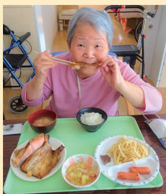
↑骨付き魚に食らいついています!

3月中旬、利用者様のリクエストで焼肉パーティを行いました。ビールやジュース、お肉に魚、さらにはメのうどんを用意。焼き始めると香りが漂い「いやーいいよね、