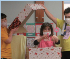
↑忘年会で手品を披露