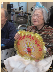
↑やったねストライク!!