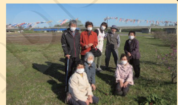
↑鯉のぼりをバックに〜はいチーズ！

毎年恒例となりました《大樹町歴舟川のこいのぼり》と《大樹町神社の桜》を見物する為、ドライブに出かけました。4月上旬から行事がスタートし1週間で利用者様全員に見ていただくことができ