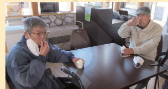
↑ソフトクリームおいしー！！