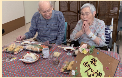
↑美味しいお寿司を頂いてご満悦

5月17日、空グループの利用者様の誕生日会をしました。夫婦揃って参加され、お寿司と天ぷらを用意し召し上がっていただきました。終始、笑顔が見られ、お二方からは「また、お寿司と天ぷら食べたい