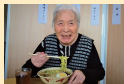
↑こんないっぱい食べられるかな?