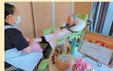
↑本格的なアロマセラピーです!