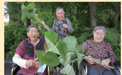
↑大きなフキを持ってチーズ！！

冷たいアイスでさっぱりしました。外で食べるアイスは格段と美味しかったです。利用者の皆さんからは「今度行きたい場所を職員さんに話してみようかしら」と、元気な秘訣は皆で笑つて過ごすことですね。