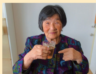
↑あんたも飲むかい?

「やっぱ肉は美味しいな」、「骨付きの魚なんて久しぶり、すごく美味しいよ」と各々喜ばれている様子で笑顔が溢れ、利用者様に感想を伺うと「こんな楽しいなら毎日やってもいいな」とお墨付きをいただきました。