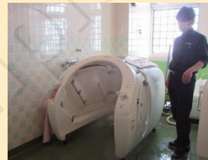
↑特殊浴槽「araeru(あらえる)」

シャワーに近いものがありますが、体の芯まで温めてくれる為、入浴後もポカポカ状態が続きます。実際に入浴体験してみると、体がしっかりと洗浄され、洗剤の匂いが残っていないのがわかりました。入浴後も体が温かく、発汗して整ってしまいました。さらに、お肌がすべすべツルツルになる美容効果が期待できるようです。この商品が納品されたらご利用者の皆様に入浴していただき、効果を実感してくださいね。