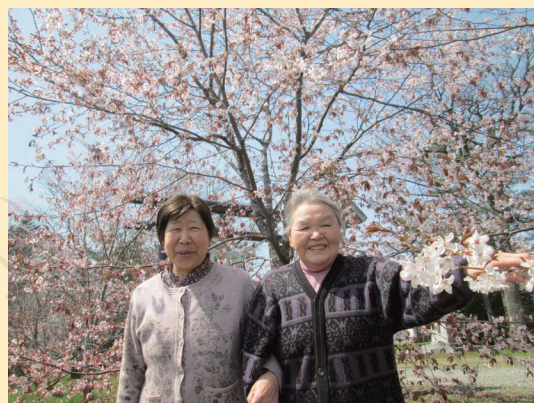
↑仲良し花見ドライブとなりました!

名物である《歴舟川の鯉のぼり》は車内から見物、《忠類キャンプ場の桜》は外に出て見物、今年は気温が低く、葉桜でしたが、とても綺麗に咲いていました。利用者様からは「良い所に連れてきてくれてありがとう」と満足していただきました。