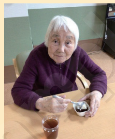
↑ようかん美味しいね