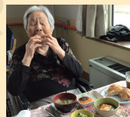
↑大きく口を開けてガブリ！