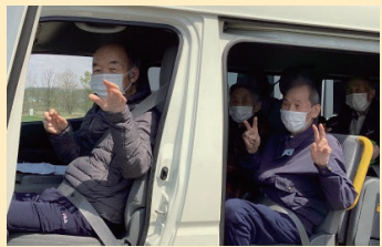
↑みんなでピース！いってきまーす

4月25日、札内寮の周辺にて桜が色づき始めていた為、利用者様方と職員はバスに乗り桜を見に出かけました。車内からの見物でしたが、利用者様は、「きれいだね、また来年も来ようね」と満足そうな表情でした。