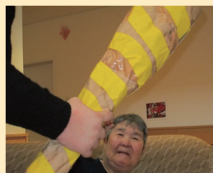
↑鬼は〜外〜! 福は〜内・・・

2月3日、節分をしました。いつもながらお面を被った鬼役の職員は各ユニットを周り利用者様の元へ襲いかかるという設定です。利用者の皆様は初めはびっくりした表情になりましたが、すぐ真剣な表情に戻り、「鬼は〜外、福は〜内」と、鬼に豆を投げて楽しんでいただけました。本