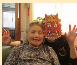
↑仲直りのツーショット

福は内」の掛け声で鬼にぶつけます。鬼はた「まいた、まいた」とたまらない様子で降参した為、利用者の皆様はその姿を見て笑いが起きました。最後は鬼と一緒に記念撮影をしました。