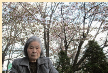
↑桜がきれいで癒されます