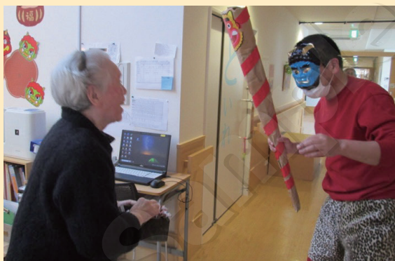
↑さー退治するわよ!! 覚悟しなさい!

2月3日、節分をしました。いつもながらお面を被った鬼役の職員は各ユニットを周り利用者様の元へ襲いかかるという設定です。利用者の皆様は初めはびっくりした表情になりましたが、すぐ真剣な表情に戻り、「鬼は〜外、福は〜内」と、鬼に豆を投げて楽しんでいただけました。本