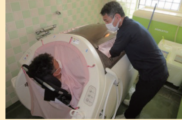
↑職員(照本)自ら入浴体験 照本：ワクワク