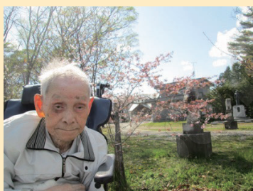
↑桜をバックに〜はいチーズ!

5月上旬、大樹神社までお花見ドライブに行きました。利用者の皆様は「いやあ、最高だね、ありがとう」と上機嫌で気分転換にされたようでした。まずは大樹町