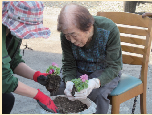
↑スタッフと共同作業

5月13日、とても天気の良い風もなく花壇づくりが絶好の日でした。久しぶりの外作業という事で利用者の皆様はすぐく張り切っています。植える花を見て顔がほころび、笑顔で、「どの花を植えようかなあ」とワクワクされている様子。利用者の皆様はスタッフから植え方を教わりながら、楽しそうに花植え作業をしました。無事に完成す