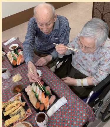
↑一貫お寿司もらうからね

ね。来年も一緒に過ごしたいね」とご感想をいただきました。今後も利用者様が楽しめるような企画をしていきたいです。