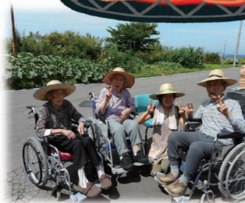
待つのも楽しみのひとつ。