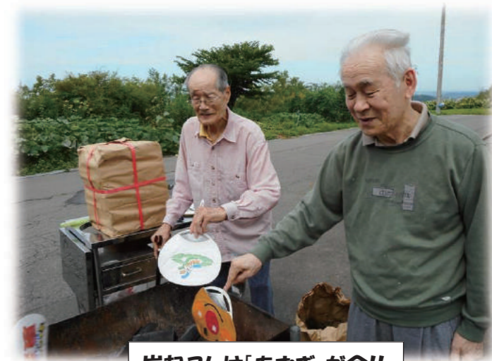
炭起こしは「あおぎ」が命!!

夏の風物詩「焼肉」を行いました。利用者の方も火おこしを手伝ってくれ、青空の下でおいしくいただきました。いつもと違った開放感もあり、若い頃の話で大変盛り上がりました。