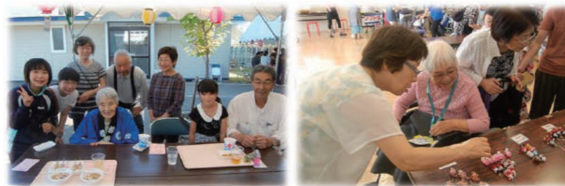
ご家族を囲み満面の笑顔

7月29日(土)、札内寮最大のイベント「夏祭り」を行いました。入居者の皆様もご家族の方と共に、江陵高校のよさこいや露店などを楽しみ、満足しておりました。特に、今年開催したいろいろな行事を音楽と共に上映したスライドショーやカラオケ大会千本くじなど、各ユニットで行われたイベントには多くの方が集まりました。