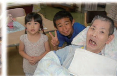
ひ孫さんとパチリ。感極まって…。