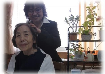
～皆さん本当に素敵ですね～